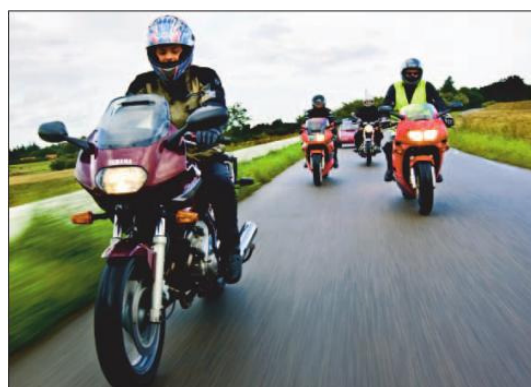
Scoutriders ligner måske almindelige motorcyklister på overfladen, men under motorcykeltøjet gemmer sig både FDF-uniformsbluser og tørklæder.